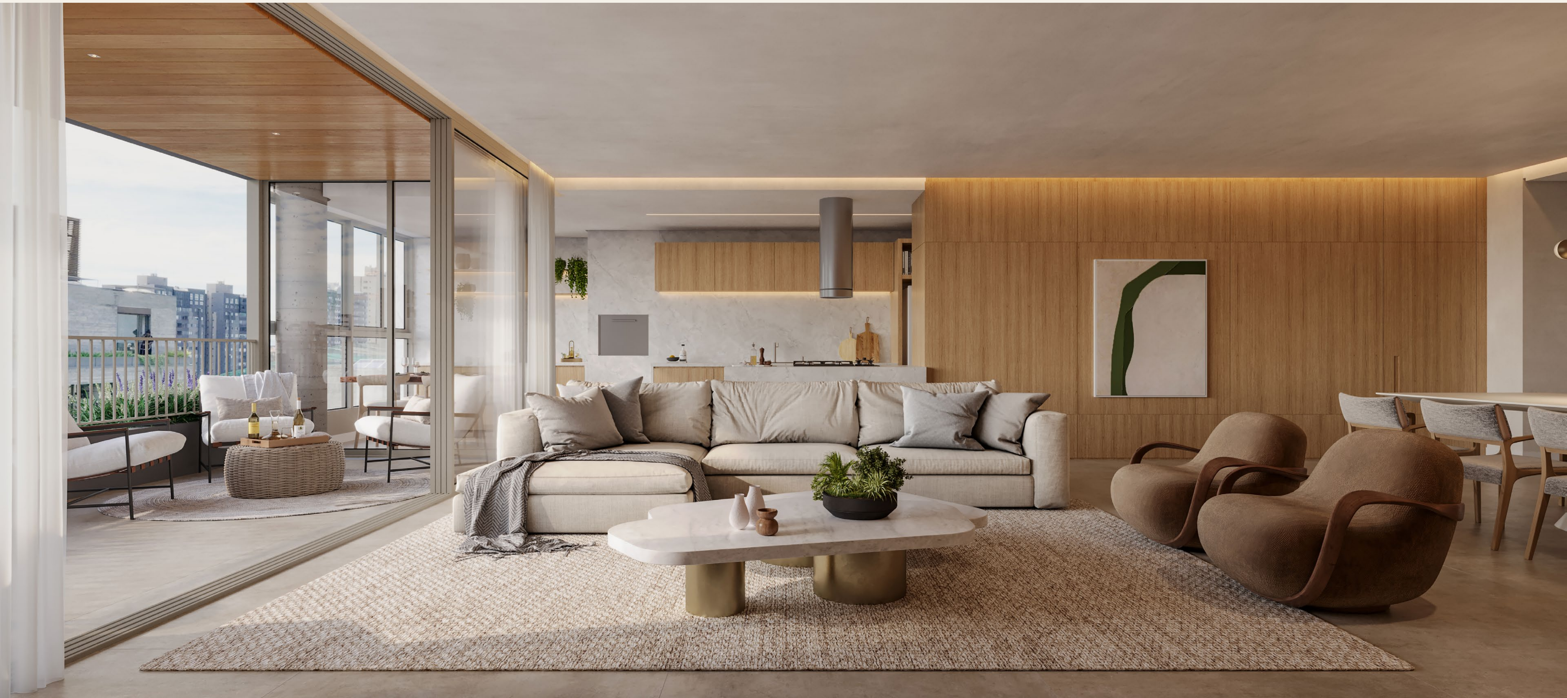
SALA DE ESTAR INTEGRADA COM COZINHA E GOURMET