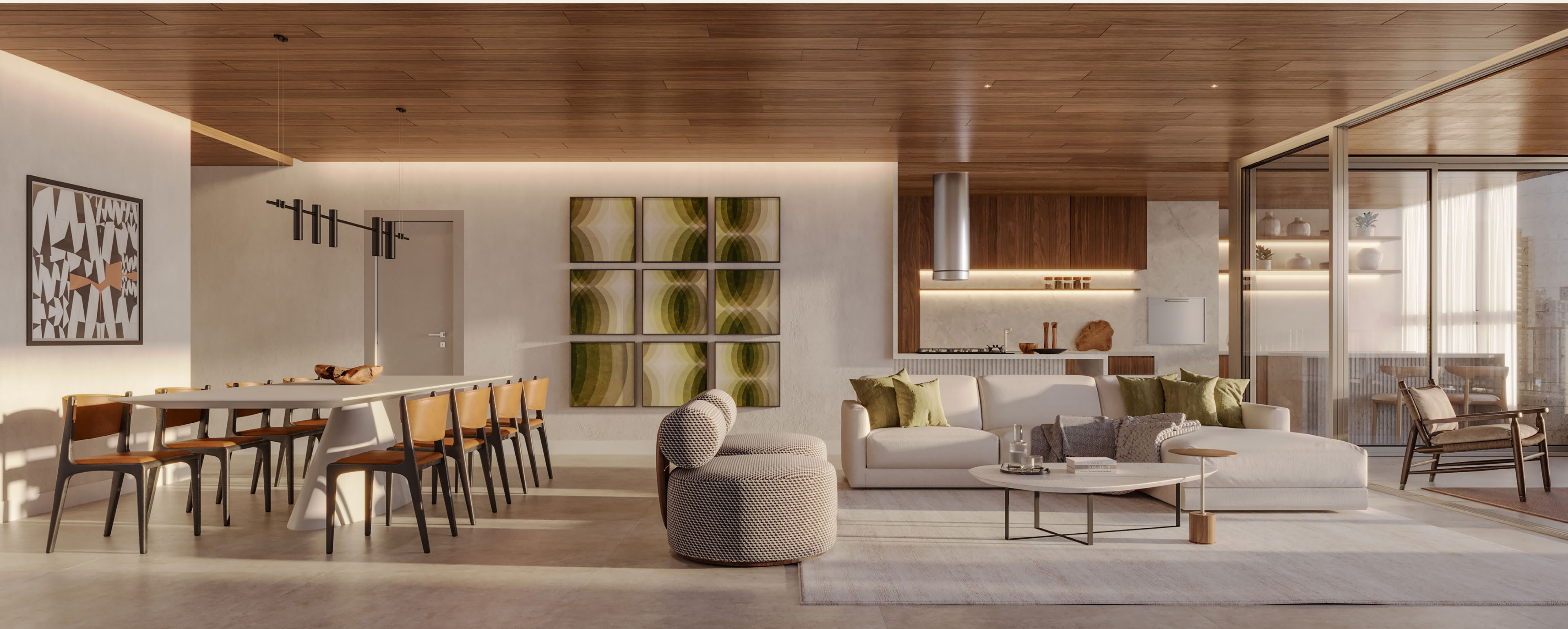
SALA DE ESTAR INTEGRADA COM COZINHA E GOURMET